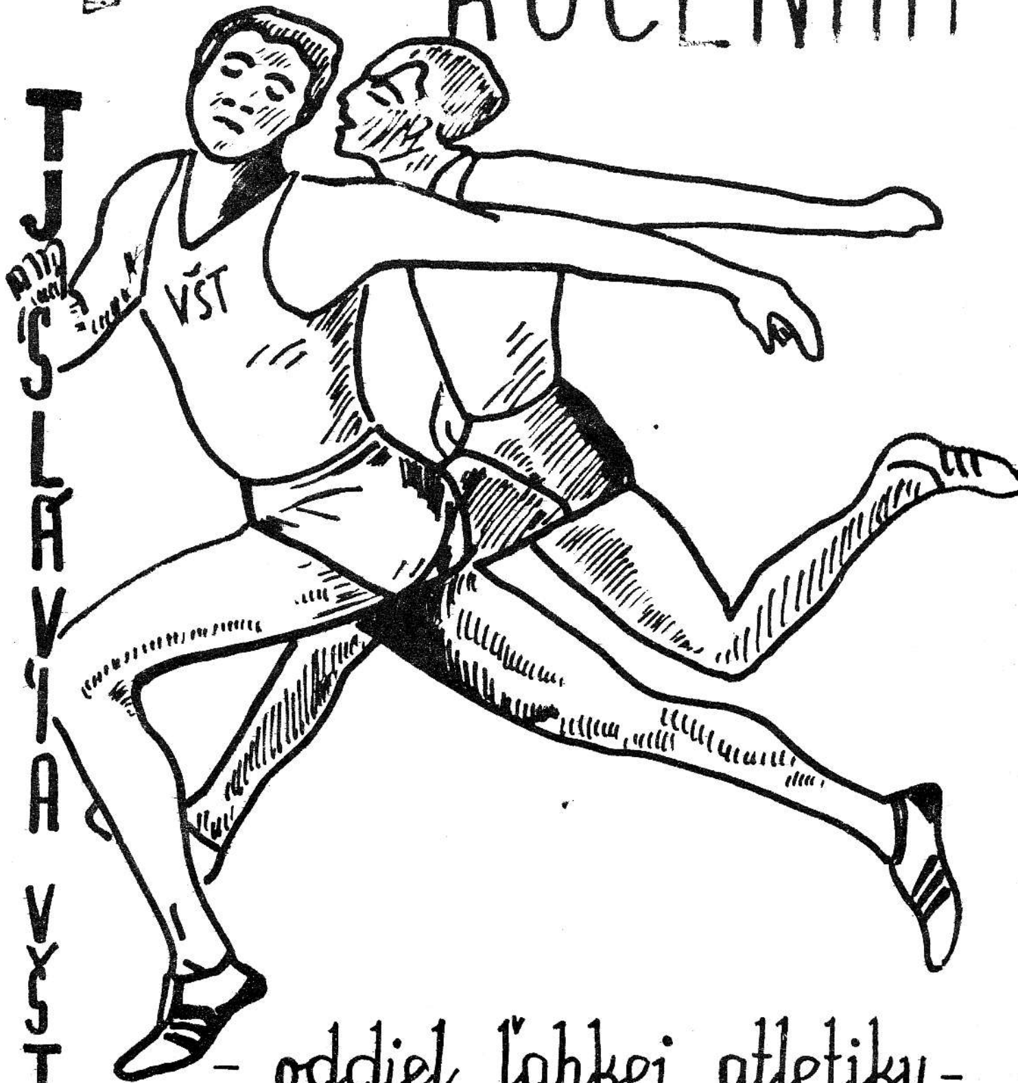
- oddiel ľahkej atletiky -